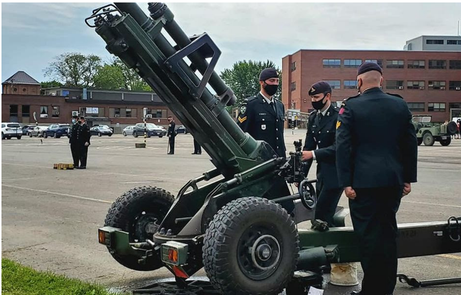
3 Fd Regt RCA / 3e RAC ARC Canada Day Gun Salute in Fredericton

--- Salve de canon de la fête du Canada à Fredericton