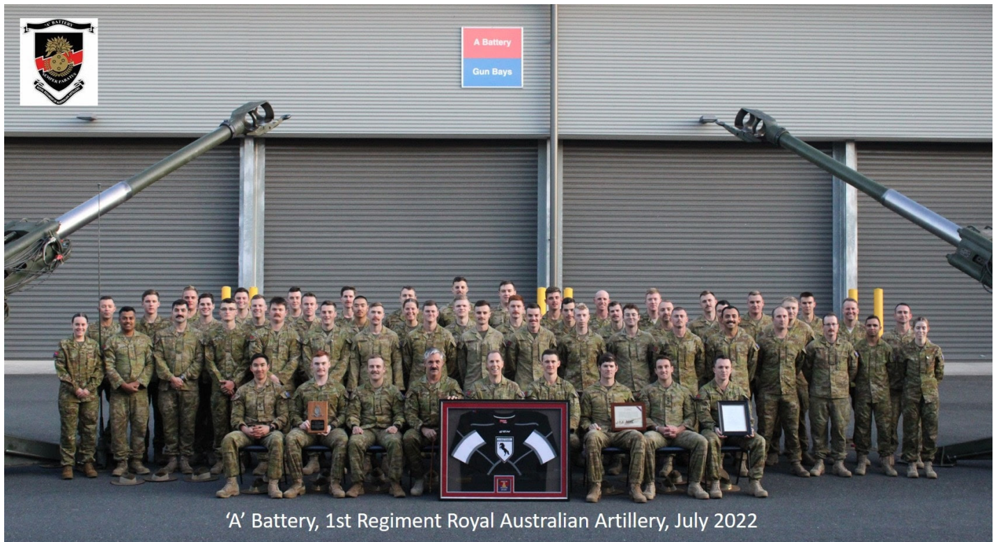
'A' Battery, 1st Regiment Royal Australian Artillery, July 2022

1st Regiment, Royal Australian Artillery