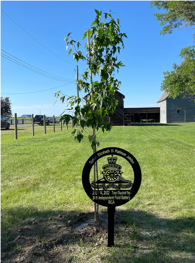
maison et le musée du patrimoine. (à gauche)

84th Ind Fd Bty RCA / 84e bataillon de construction ARC