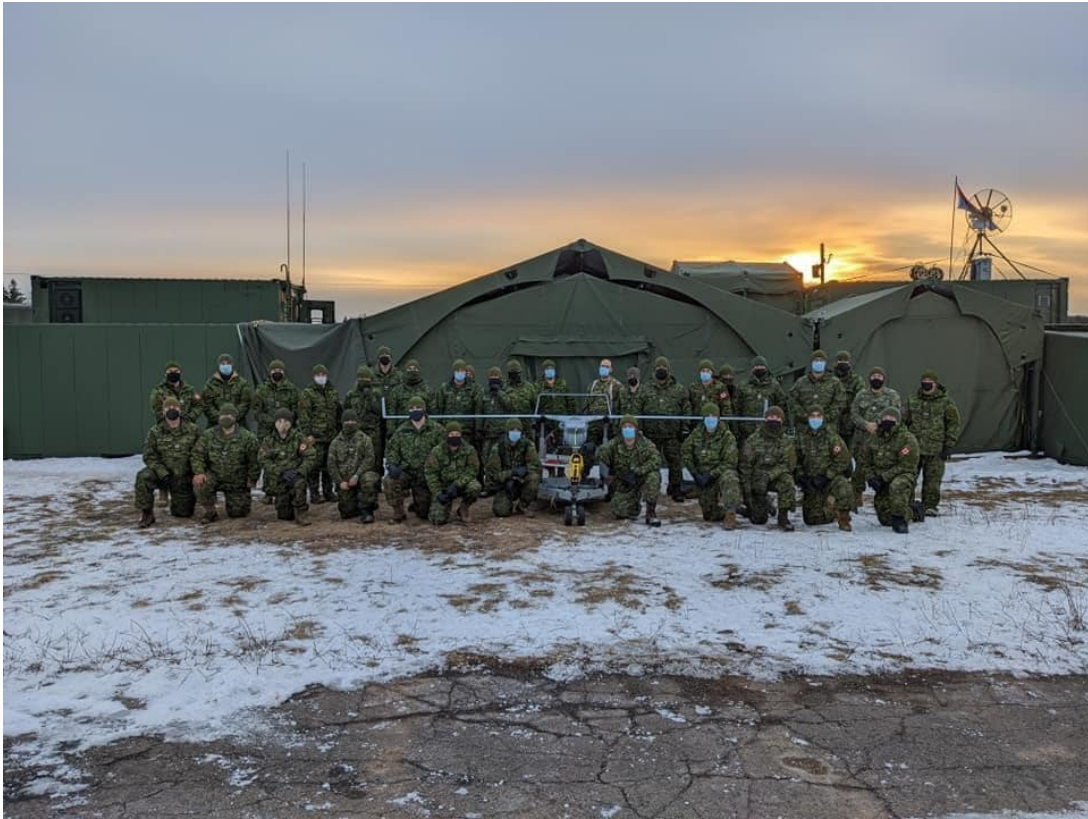
EX FLUTTERING PENGUIN