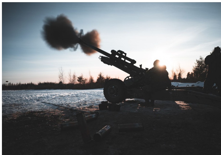
LG1 Mark II Howitzer