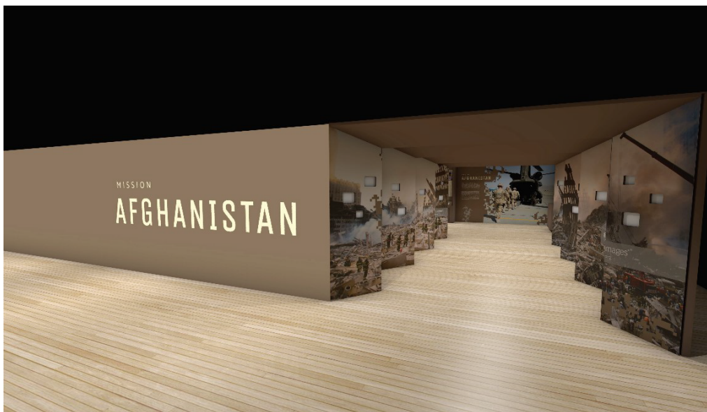
RCA Museum - Barrage April 2022 (traduction française à venir)