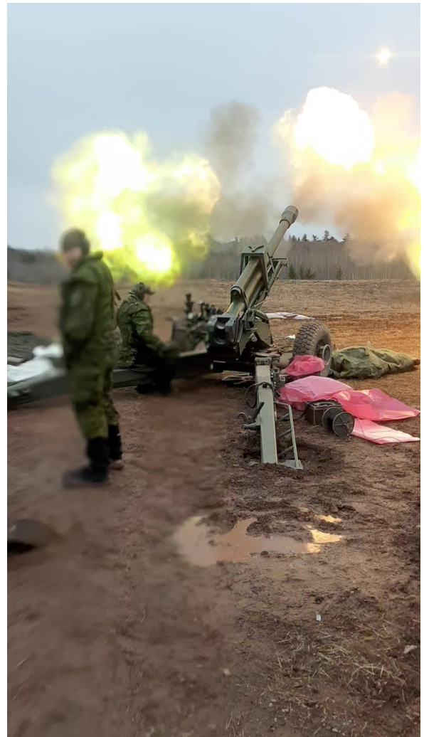
Our 5DivSoldiers from 3rd Field Artillery Regiment, RCA - The Loyal Company were not working on their manipulation or deceit skills during Exercice LOKI REVENGE, but they did train in defensive operations at Base Gagetown. # notmarvelloki