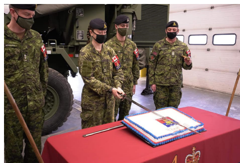
Culminating 4 Regt (GS)'s Ubique 150 celebration, the youngest

26 May is Artillery Day. Every year on this day gunners celebrate the birth of artillery internationally. Although Canada adopted its observance in 1952, the Royal Artillery has recognized this as the birthdate of artillery since 1716. To celebrate, Canadian gunners hold events in the form of community gatherings and displays. Doors remain open to family, friends, and the general public who are all