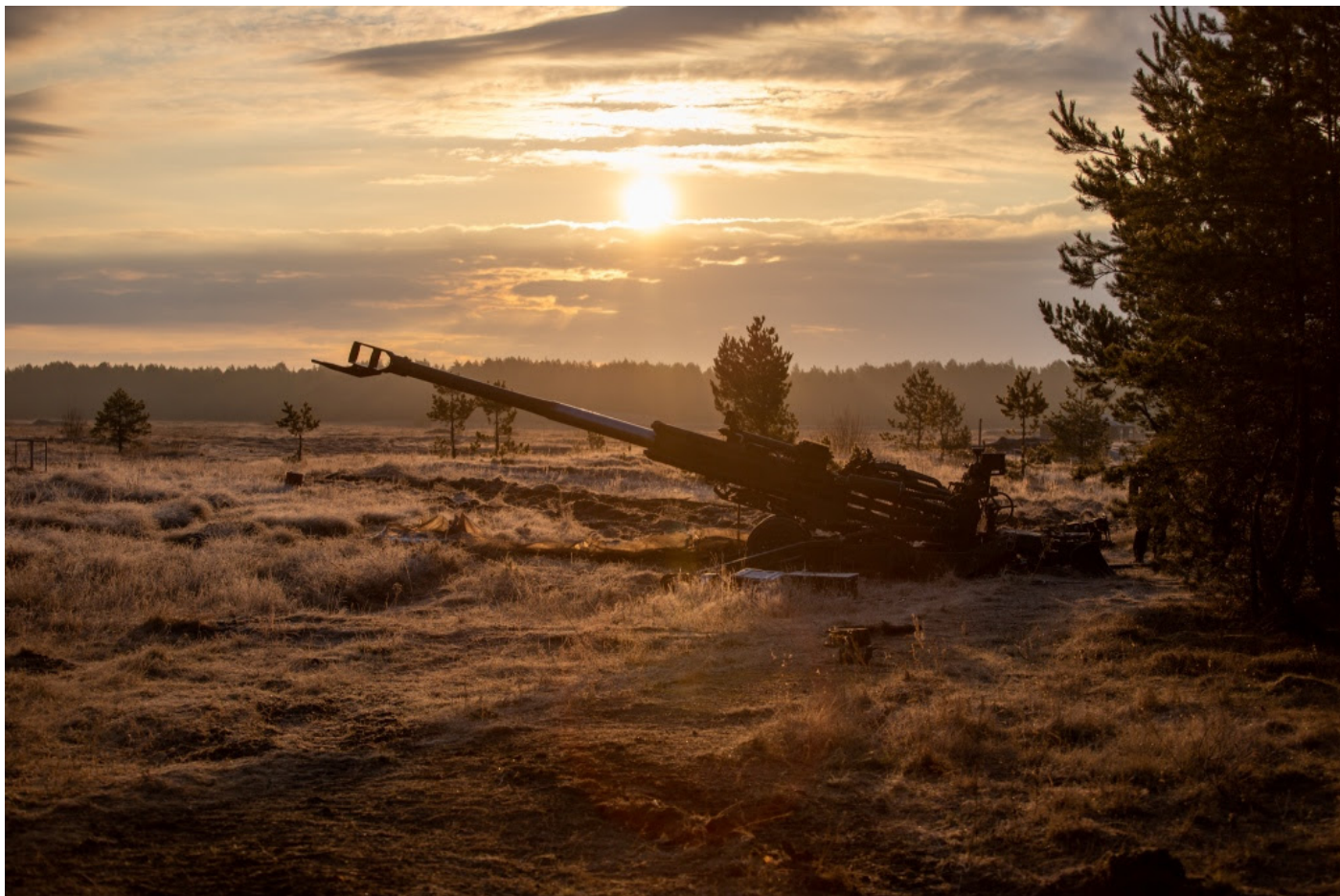
Winner, Sep 2020 / gagnant, septembre 2020 - Master-Corporal / Caporal-chef Yan Lafreniere – Rise and Shine (M777-Latvia)

Les dates limites d'inscription sont fin mars, juin, septembre et décembre. Toute photo arrivant après la date limite sera ajoutée au prochain concours. Tous les détails ici